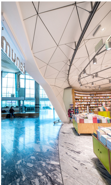
Detailansicht verkleidete Holzkonstruktion