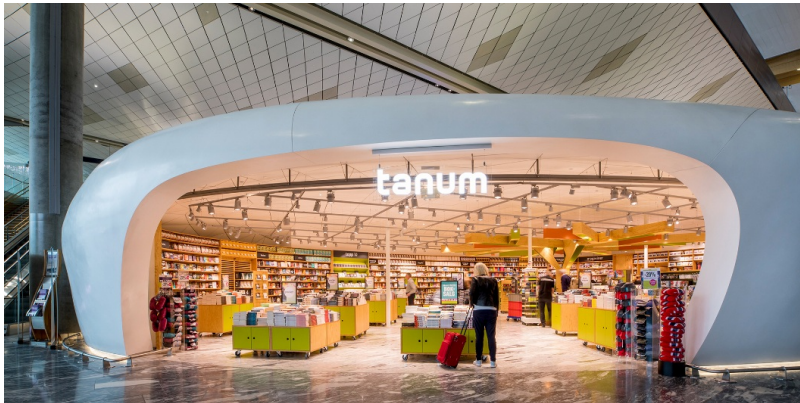
Pavillon im Transitbereich