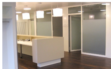
Empfangsbereich mit Tresen