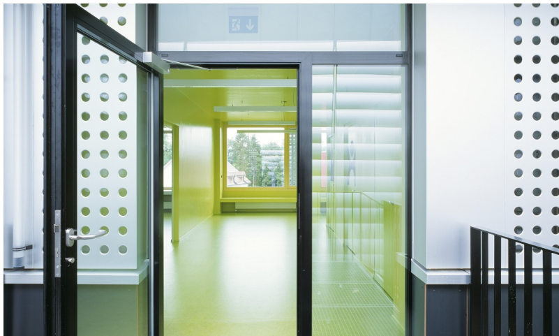
Grosszügiger Eingangsbereich im provisorischen Schulhaus