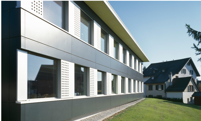
Temporäre Schulhaus-Modulbau Hasenacker mit Fassade in Anthrazit- Weiss