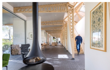
Vue détaillée de la toiture