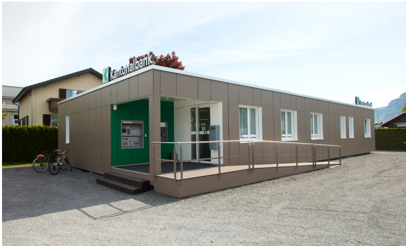
Entrée avec rampe d'accès pour fauteuils roulants