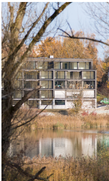
Construction en bois de 4 étages sur un socle massif