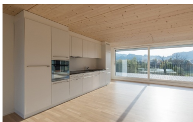
Salon très lumineux