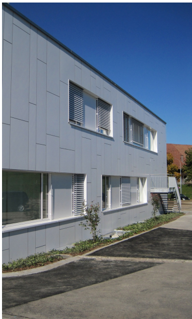
Bâtiment temporaire à deux étages