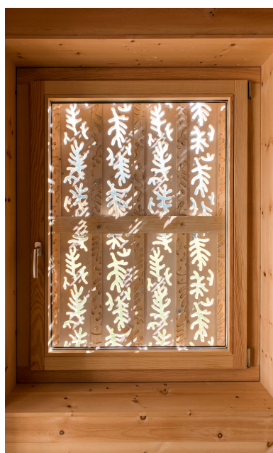
Les ornements de la façade sont également visibles à l'intérieur