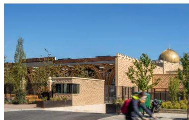
Zone d'entrée de la mosquée