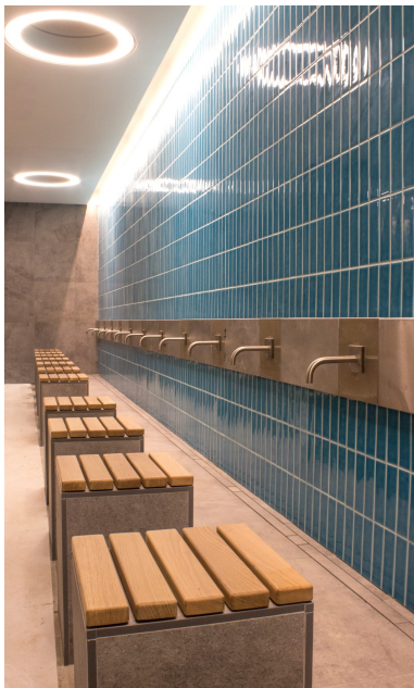
Espace pour le rituel de purification des fidèles