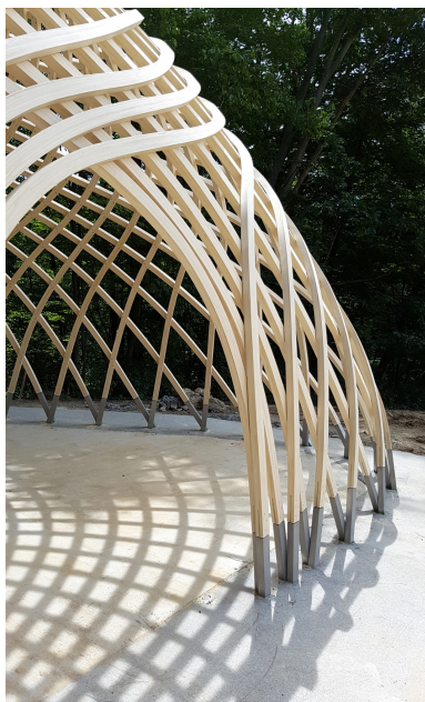
Vue détaillée d'une construction en forme libre