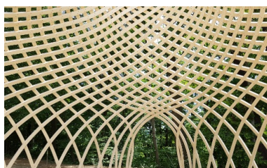
Vue d'ensemble d'un pavillon