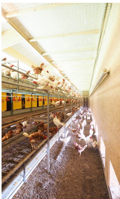
Beaucoup de lumière naturelle dans le poulailler