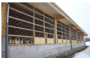
Climat agréable dans le poulailler pour les poules pondeuses bio