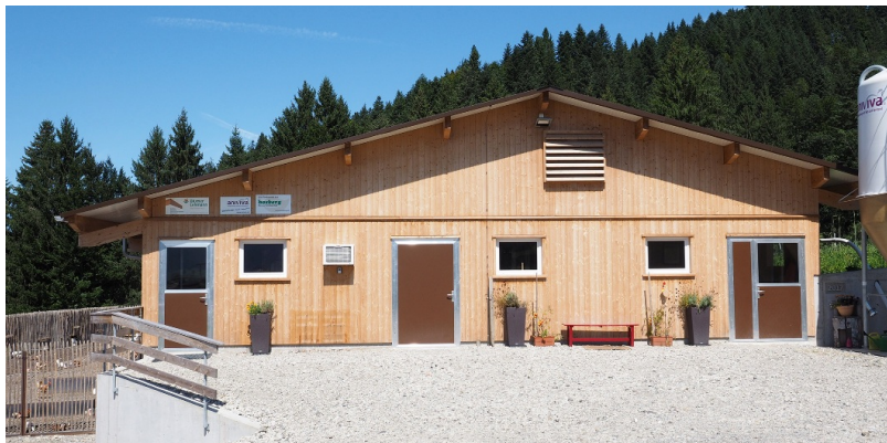
Façade avant avec bardage en sapin et épicéa