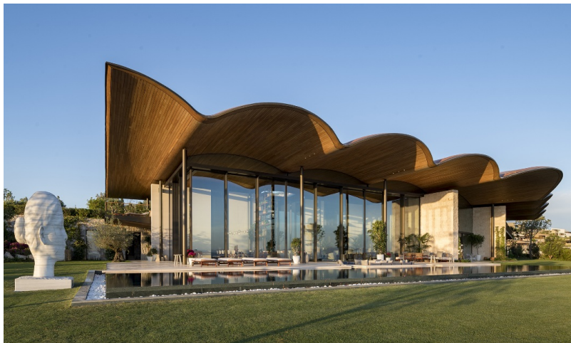
Villa privée avec piscine