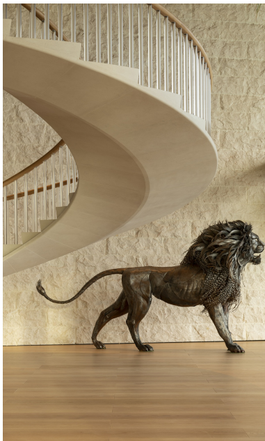
Design d'intérieur élégant