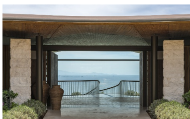
Vue sur la mer depuis la terrasse