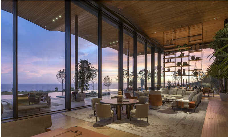
Intérieur spacieux avec vue sur la mer