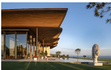
Le bois crée des contrastes sous une forme étonnante.